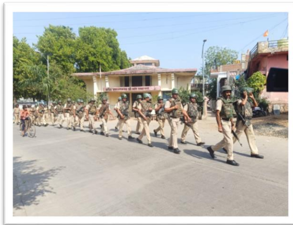
पोलीस माहिती कक्ष नागपूर जिल्हा (ग्रामीण), नागपूर